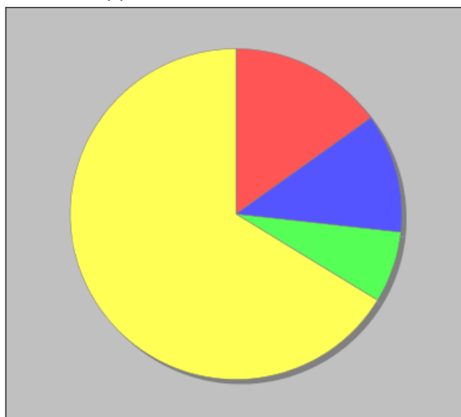
Distribuzione dei docenti a T.I. per anzianità nel ruolo di appartenenza (riferita all'ultimo ruolo)